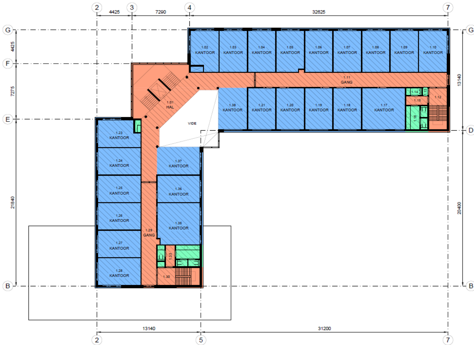
Plattegrond eerste verdieping