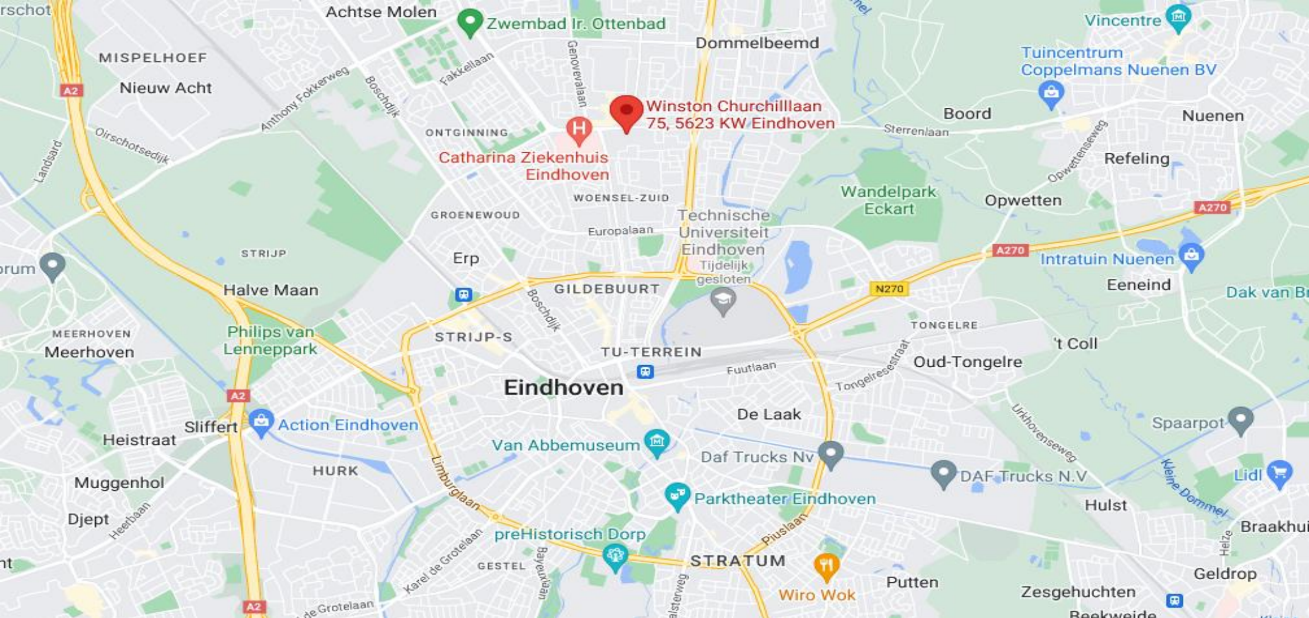
Winston Churchillaan 75 te Eindhoven